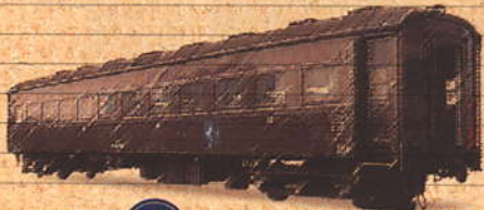
5月 車両特別公開 【オハ35形】

(オハ35206) 3等車 昭和14年から製造された代表的な戦前製の3等客車。初めて窓の幅が1000mmと広くなり、室内が明るいと評判になった。