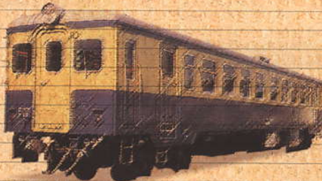
4月 車両特別公開 ※3/28(土)公開 【キハ48000形】

(クヤ165-1) 直流教習制御車 サハシ153形直流普通会堂付随車を昭和49年に改造。運転士を教育するための直流教習制御車として生まれ変わった。